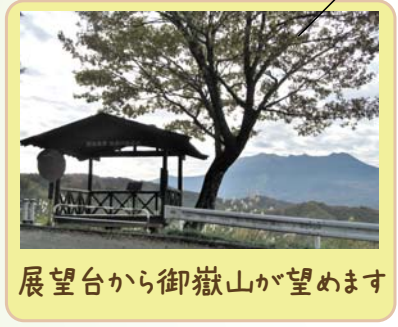
展望台から御嶽山が望めます