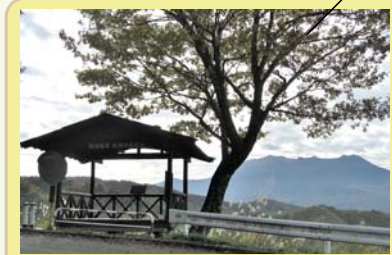
展望台から御嶽山が望めます